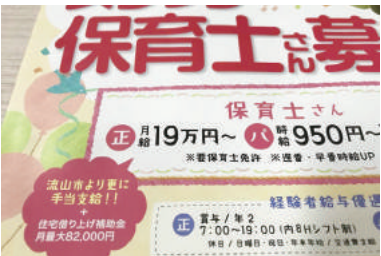
流山市 新規保育士の募集広告

流山市の新規保育園の保育士さんの募集チラシを新聞折り込みで見ました。際目に付いたのは、手当支給の項目であり ます。それは、 勤務先の保育園のお給 料とは別に、 流山市から も毎月手当 の支給がな されること でした。