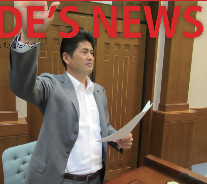
平成30年 6月定例会月議会。12日、「市政に関する一般質問」に登壇