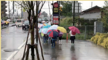
海老原踏み切りを朝、通学する、黒内小学校の児童の様子